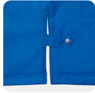
スリット調節機能