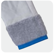
ボアとキルティングの 2段構造