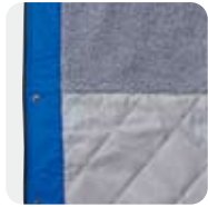
ボアとキルティングの 2段構造

裏地には、キルティング生地とボアを使用。袖入り口はボアで保温性を確保し、袖全体はキルティング生地、着用しやすくしています。ボアは、服についても目立たないようにグレーカラーにしています。