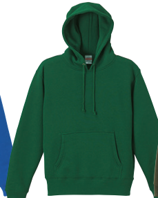
497 アイビーグリーン